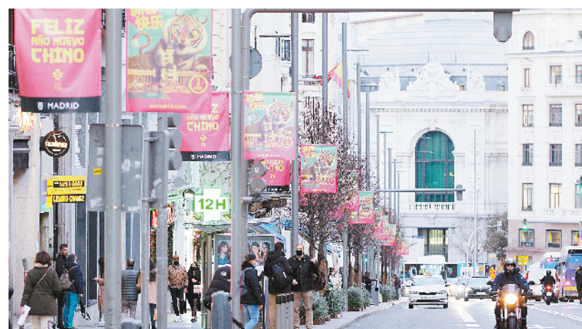
“虎”元素点缀西班牙马德里 这是1月25日在西班牙马德里市中心拍摄的中国春节生肖海报与贺年标语。西班牙马德里市政府每年都会邀请艺术家设计一款生肖海报,用以装饰街道,迎接中国春节。