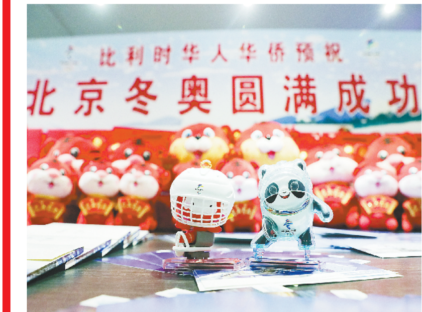
比利时华人华侨为北京冬奥送祝福 这是1月25日拍摄的比利时侨胞“迎冬奥送祝福”活动现场展出的北京冬奥会吉祥物“冰墩墩”与“雪容融”。当日,旅居比利时的华人华侨在比利时第二大城市安特卫普举办“同心筑梦·祝福北京”——比利时侨胞“迎冬奥送祝福”活动,为2022年冬奥会和冬残奥会加油鼓劲。