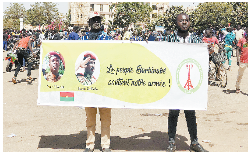
布基纳法索瓦加杜古的民族广场 1月25日,示威者聚集在布基纳法索首都瓦加杜古的民族广场支持政变军人(手机拍摄)。布基纳法索政变军人24日在国家电视台发表讲话说,军方已夺取政权,并解除总统卡博雷的职务。