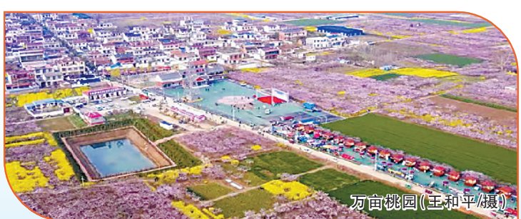
万亩桃园

初秋时节，记者驾车从西华县城出发，行驶几公里至安罗高速出入口，步行百余米，忽逢桃林，林深处一村庄，“土地平旷，屋舍俨然。阡陌交通，鸡犬相闻。黄发垂髫，并怡然自乐……”陶渊明笔下的梦幻“桃花源”在这里“重现”。