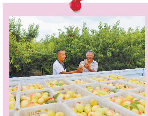
桃子上市

黄桥乡党委、乡政府借势而为，积极发展休闲农业经营主体26个，其中农家乐6个、休闲农园8个、乡村民宿6个，每年营业收入8000万元，年接待游客百余万人次。经营项目主要有农事体验、乡土美食、休闲康养等，经营范围涵盖食、游、娱、购、宿等方面。休闲产品有鲜桃、桃酵素、葡萄、小西瓜、草莓等农产品，桃木手工艺品、金蝉、桃胶等特色产品，年经营性收入2.6