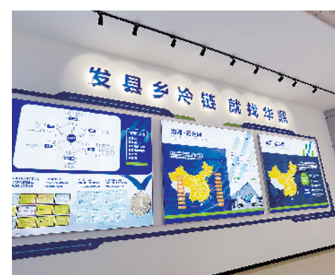
华鼎冻品批冷冻食品产业园建设项目。