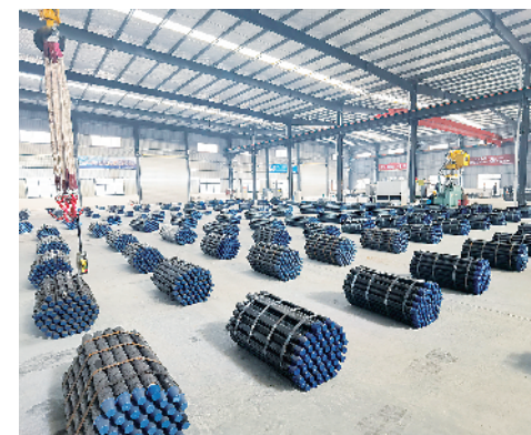
中煤科工高端装备制造项目。