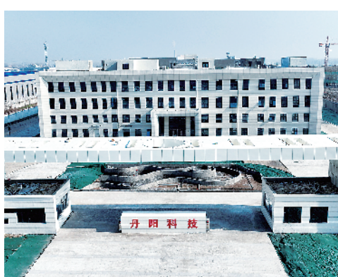
河南丹阳生物科技有限公司年产10万吨大健康功能性饮品项目。