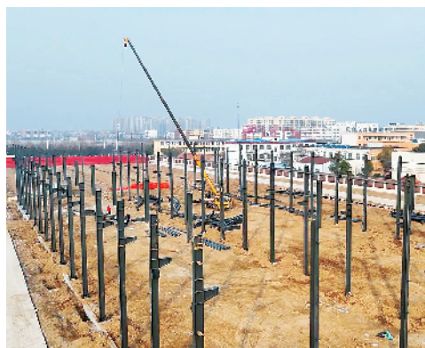
河南小牛物联网智能科技项目。

该项目总投资5亿元,匹配专业化化妆质量检测线,包含全电脑测控拉力强度测试仪、高性能环境试验箱、MBS微生物快速检测系统和BOHS光谱仪等设备,预计年产1100万套化妆刷。目前,项目已建成投产,预计年产值可达5.4亿元,利税约1.35亿元,可带动就业500人。