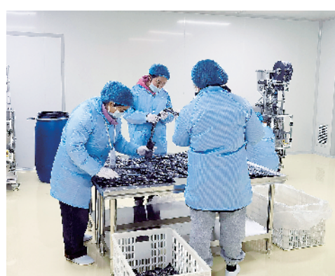
百草园(河南)中药有限公司中草药提取产业基地建设项目。