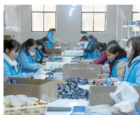
觅己美业科技产业园建设项目。