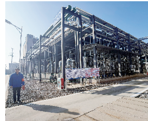
河南康达制药有限公司高端原料药项目。