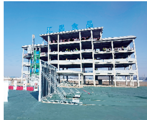
河南汇昌食品科技产业园项目。