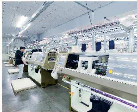
河南盛泰针织年产36000吨高档针织坯布面料项目。