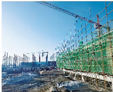
高水县农副产品精深加工产业园项目。