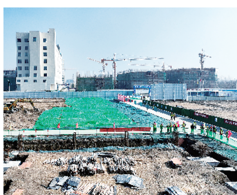
周口(郸城)同福大健康食品城建设项目。