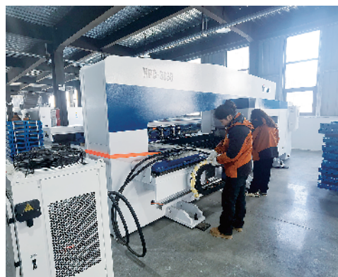
河南国网自控电气有限公司智能配电开关系统项目。