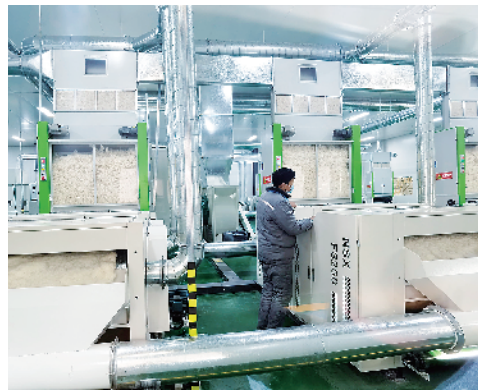
高水县废旧纺织品再生循环利用项目。