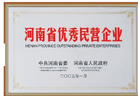
河南省优秀民营企业。