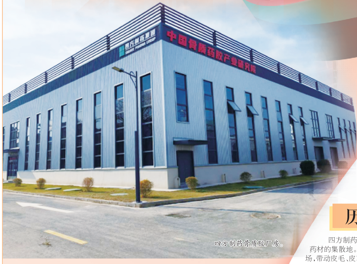
四方制药骨质胶厂房。

在中医药的浩瀚历史长河中,药胶作为一味重要的滋补佳品,自古以来便备受推崇。提起药胶,许多人首先想到的是山东“东阿阿胶”,然而,在河南周口,一家以药胶起家的企业——河南省四方药业集团有限公司(简称四方制药),以其深厚的历史底蕴和卓越的产品实力,悄然崛起为行业的领军者,被誉为“南阿胶”。如今,它以药胶生产为基点,进军大健康产业,打造百亿元全产业链,成为我国中药界一颗冉冉升起的新星。