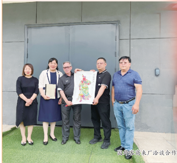
国外客商来厂洽谈合作。