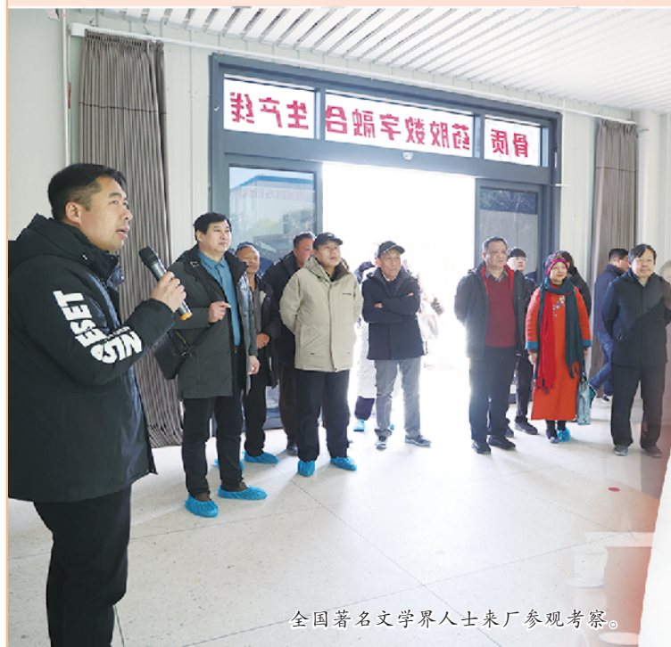
全国著名文学界人士来厂参观考察。

在新时代的征程上,四方制药正以昂扬的姿态,书写“南阿胶”的光荣与梦想,为中国中医药产业的发展注入新的活力。