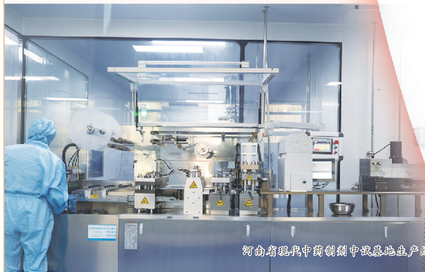
河南省现代中药制剂中试基地生产线。