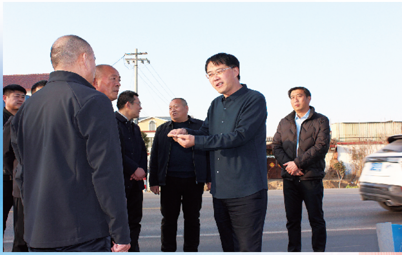
群力群策,共建共享。