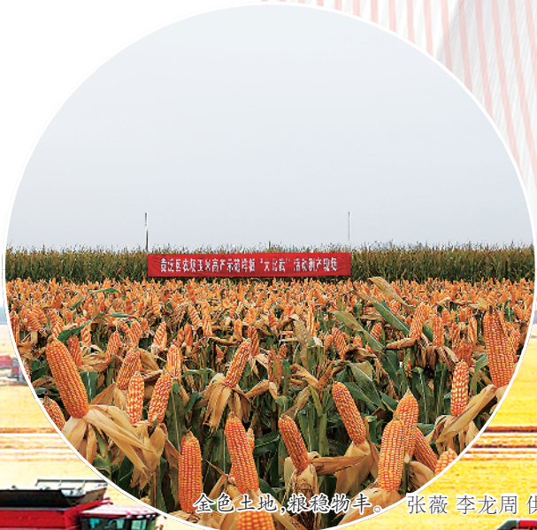
金色土地,粮稳物丰。

黄泛区农场,一片充满故事的土地。这里的每一寸土地,都铭刻着往昔的风雨与今朝的蓬勃。 1938年,因战事,花园口黄河大堤被炸开,豫东平原沦为泽国,洪水退去,留下荒沙肆虐的“黄泛区”,民生凋敝,满目疮痍。新中国成立后,希望的曙光洒向这片土地。1950年,中央黄泛区复兴委员会成立,开启复兴之路。次年,黄泛区农场诞生,来自各地的拓荒者扎根于此,开启创业征程……2019年进行“政企分离”职能改革,行政管理职能移交至(原)周口经济开发区;2023年3月,黄泛区农场党工委、管委会成立。 “黄泛区农场党工委、管委会成立以来,认真贯彻落实省委、省政府决策部署和市委、市政府工作要求,紧紧围绕‘接得住、管得好、服务好、发展好’要求,深谋实干、向新而生,城镇建管、民生保障水平持续提升,产业发展稳步跃升、项目建设起势见效、人居环境持续提质、党员干部干劲十足,社会大局和谐稳定,经济社会事业迈入良好发展轨道。”黄泛区农场党委书记张锐说。