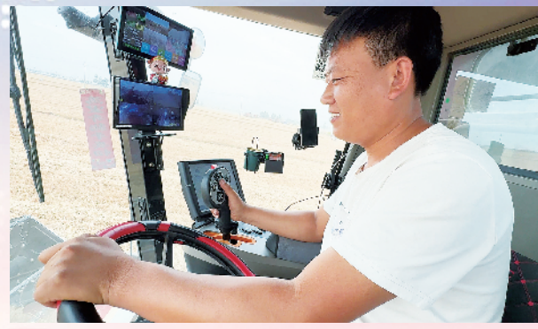
农机轰鸣,劳作欢歌。