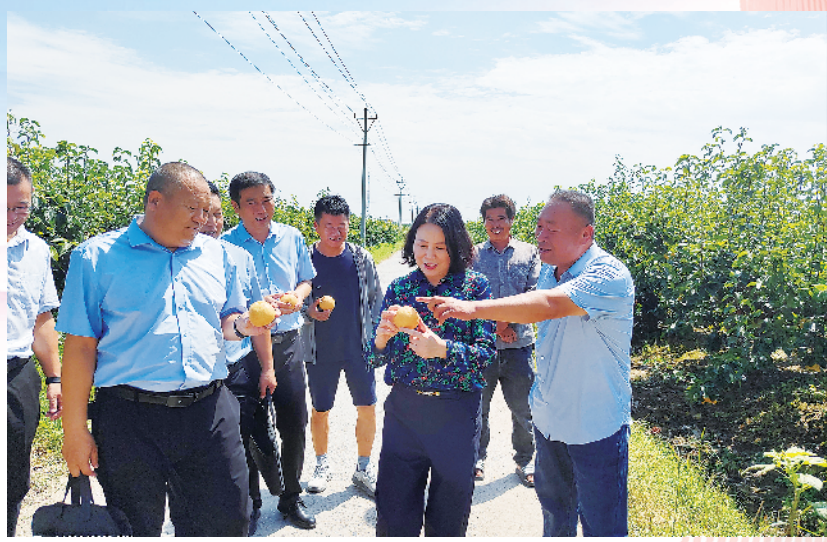
瓜果飘香,远销海外。