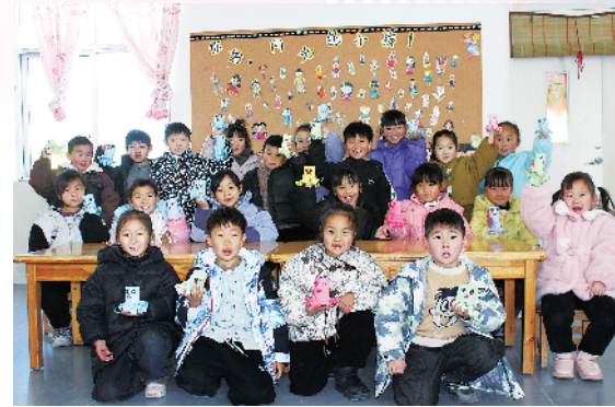
民生工程,深得民心。