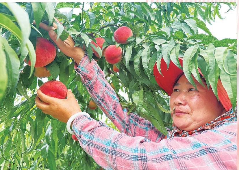
喜获丰收,农强民富。