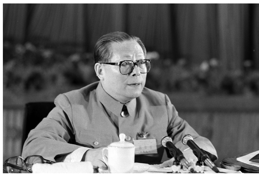
1989年6月23日至24日，中国共产党第十三届中央委员会第四次全体会议在北京召开。这是江泽民同志在会上讲话。