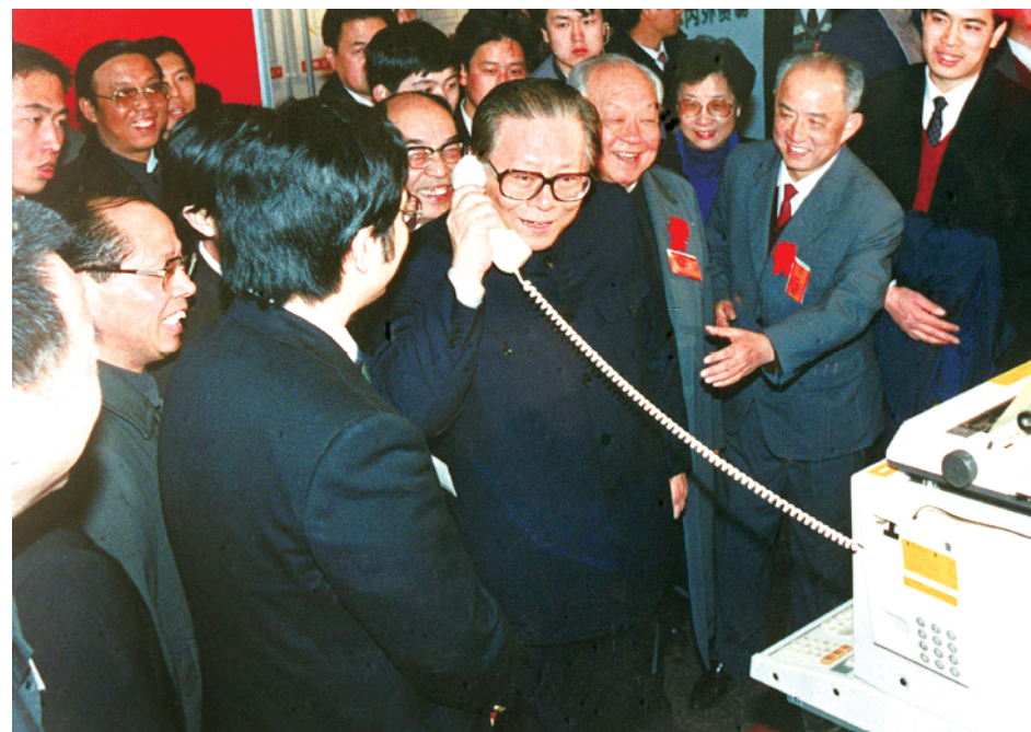
1984年5月，江泽民同志在北京展览馆举行的全国电子新产品展览会上，试用国际长途电话向远方的工作人员问候。