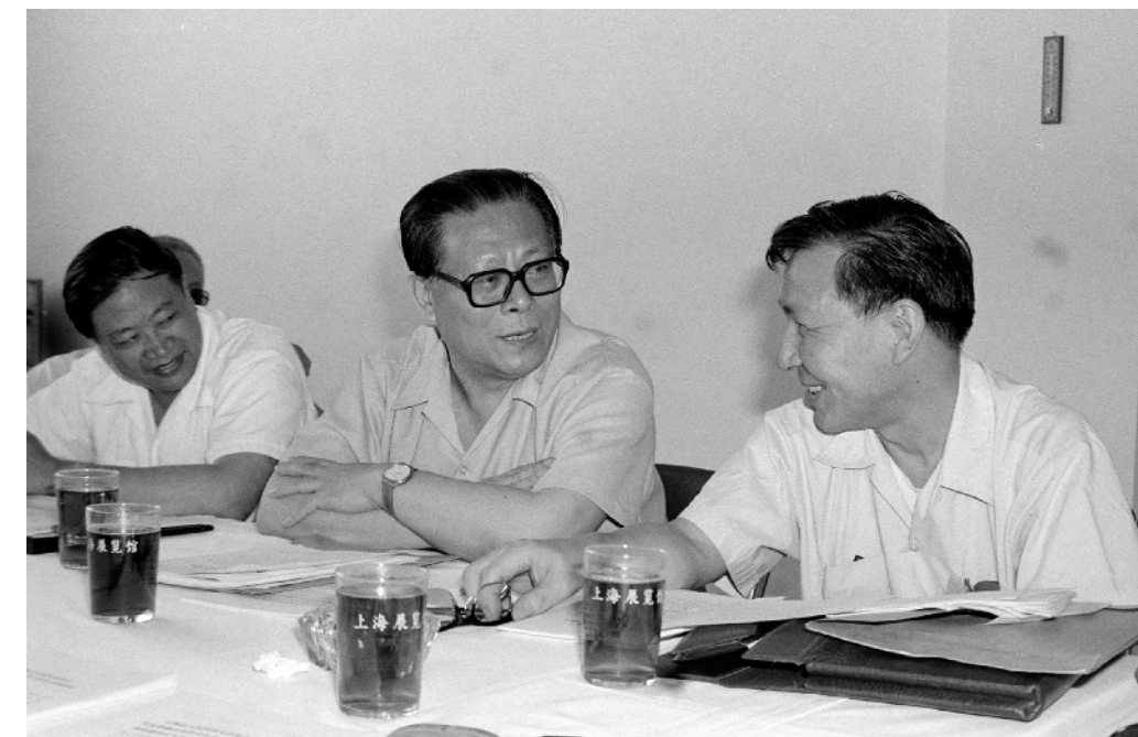
1985年，江泽民同志在上海市八届人大四次会议上。