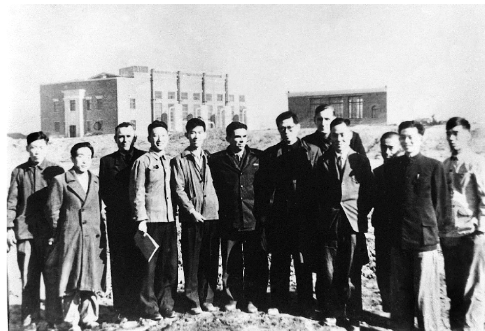
1956年，江泽民同志(左七)在长春第一汽车制造厂同援建一汽的苏联专家等合影。