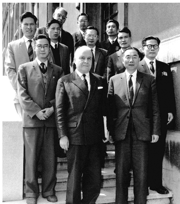
1964年6月，江泽民同志(二排右一)在法国艾克斯莱班出席国际电工委员会会议期间与会代表合影。