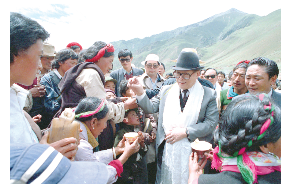
1990年7月25日，江泽民同志与藏族群众共庆望果节。