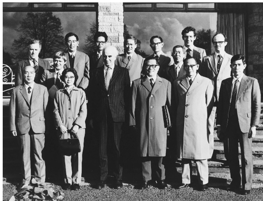
1980年10月底，江泽民同志(前排右三)在爱尔兰香农开发区考察时同开发区负责人等合影。