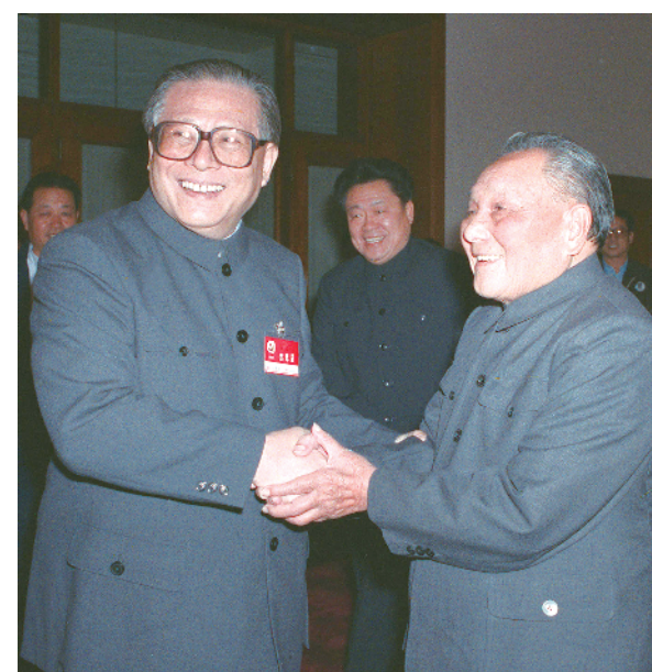
1989年11月6日至9日，中国共产党第十三届中央委员会第五次全体会议在北京召开。这是邓小平同志和江泽民同志亲切握手。