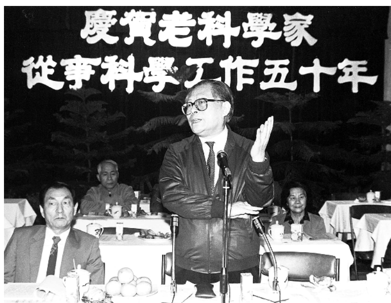
1988年10月，江泽民同志在上海庆贺老科学家从事科学工作五十年座谈会上讲话。