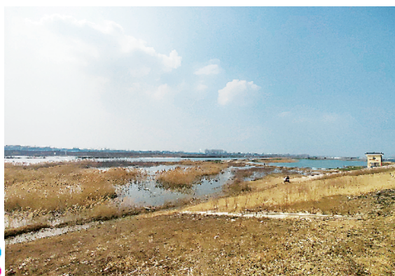
贾鲁河(扶沟段)大堤。