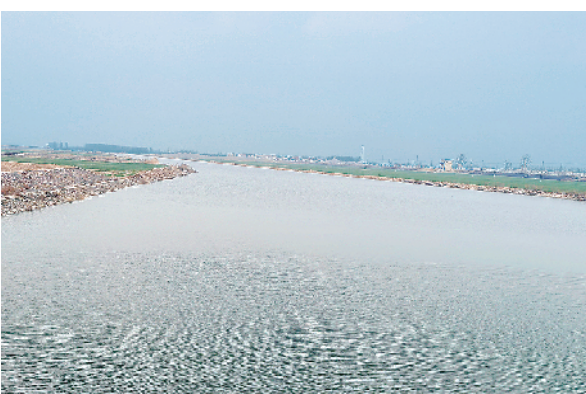
综合治理后的贾鲁河河道。