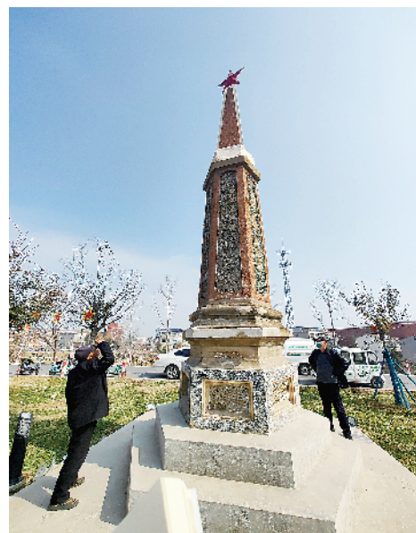
贾鲁河旁的扶沟北关老拦河闸纪念塔。